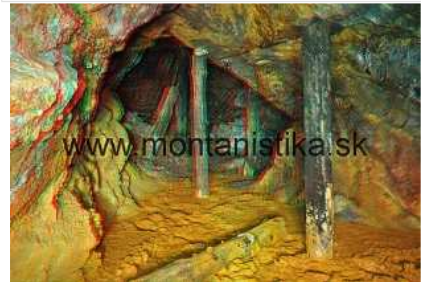
Ďalšie fotografie - kliknite .

ZÁKLADNÉ INFORMÁCIE aktuálne číslo, archív, harmonogram vydání 2012, propagačno-informačný špeciál, tiráž ■ REDAKCIA šéfredaktor ■ REDAKČNÁ RADA predseda a členovia ■ OSTATNÉ pokyny pre autorov článkov, predplatné na rok 2012, inzercia