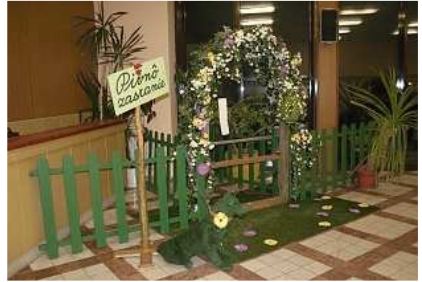
Radosť "posedieť si" v takom krásnom prostredí !?