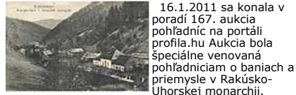
16.1.2011 sa konala v poradí 167. aukcia pohľadníc na portáli profila.hu Aukcia bola špeciálne venovaná pohľadniciam o baniach a priemysle v Rakúsko-Uhorskej monarchii. Pozrite si zaujímavé dobové pohľadnice, možno aj z Vášho regiónu, mesta alebo obce. Blížšie informácie - kliknite .